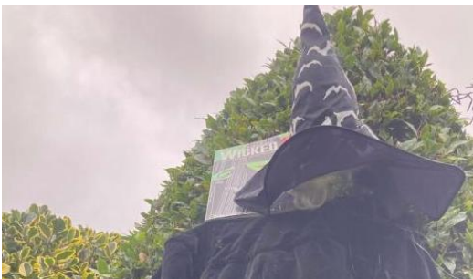
'Wicked' sa dúlra.

Foilsíodh cúig bhlag ar láithreán gréasáin an IHA in 2024 agus scaipeadh ar na meáin shóisialta iad. Is féidir na naisc thíos a úsáid chun dul chucu lena léamh: