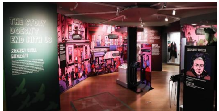
Taispeántas Bad Bridget. Le caoinchead ó Dhaonpháirc Uladh-Mheiriceá