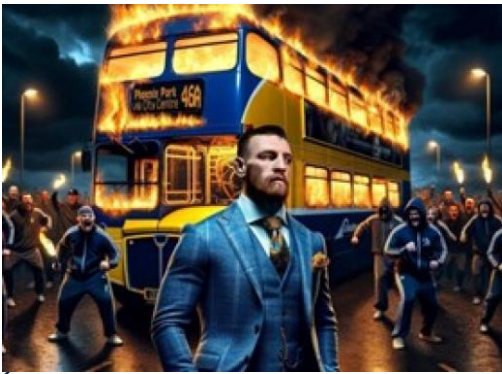
Iomhá arna giniúint ag an IS arna húsáid ag daoine atá i bhfad amach ar an eite dheas tar éis na gcíríbeacha i mBaile Átha Cliath