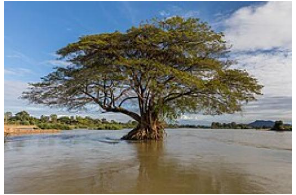
Crann faoi uisce, an Mekong.