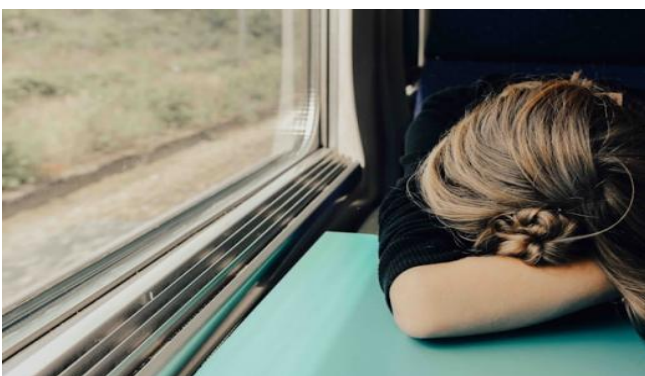
Sleeping woman le Abbie Bernet. Á atáirgeadh faoi Cheadúnas Unsplash

'Theorising Research Ecologies? An Environmental Humanities (Meta) Symposium', leis an Dr Ashley Cahillane, COBÁC